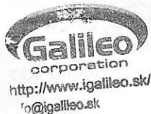
Galileo Corporation s.r.o. (zhotoviteľ)

Galileo Corporation s.r.o. Čierna Voda 488 925 08 Čierna Voda okres Galanta IČO: 47192941 DIČ: 2023788745 IČ DPH: SK 2023788745